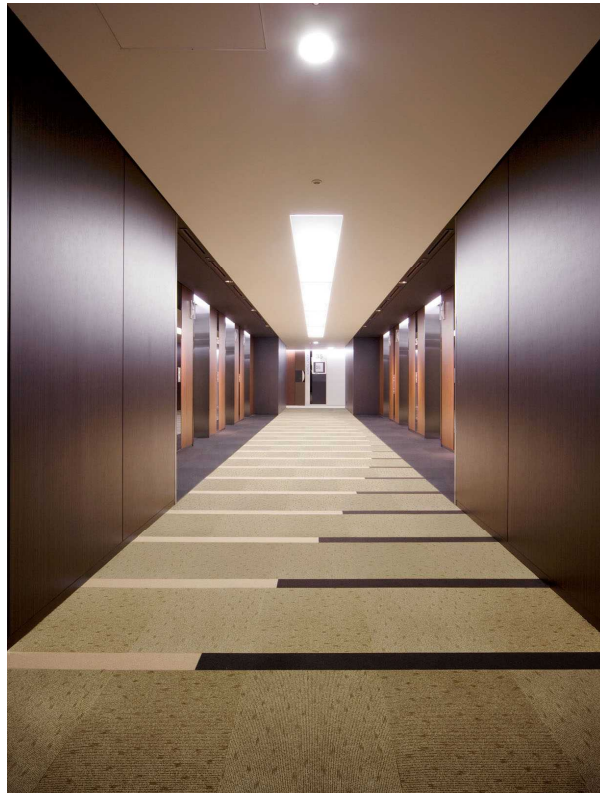
NT -2504 ・ NT -2811 ・ NT -2901 ・ NT -2906 施工例