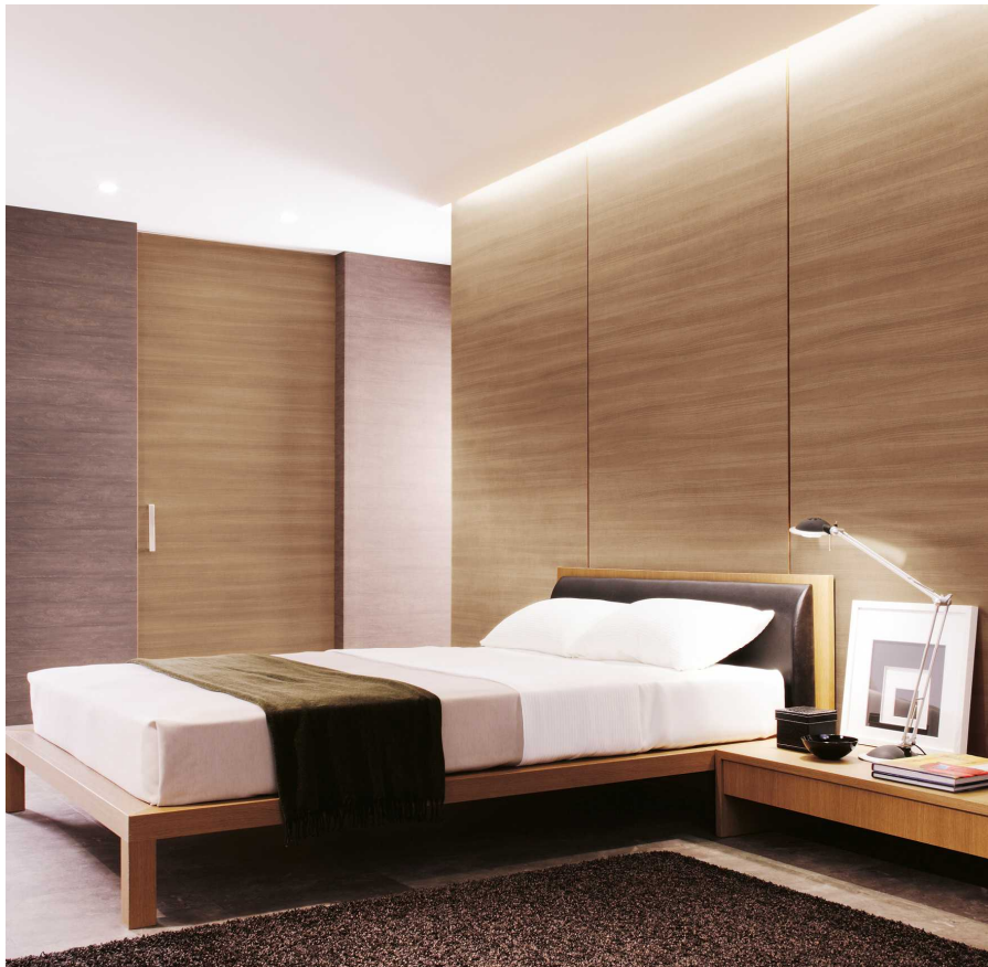
TC-1768 の施工例 TC-1768:5,800 円/平米 (税別・施工費別)